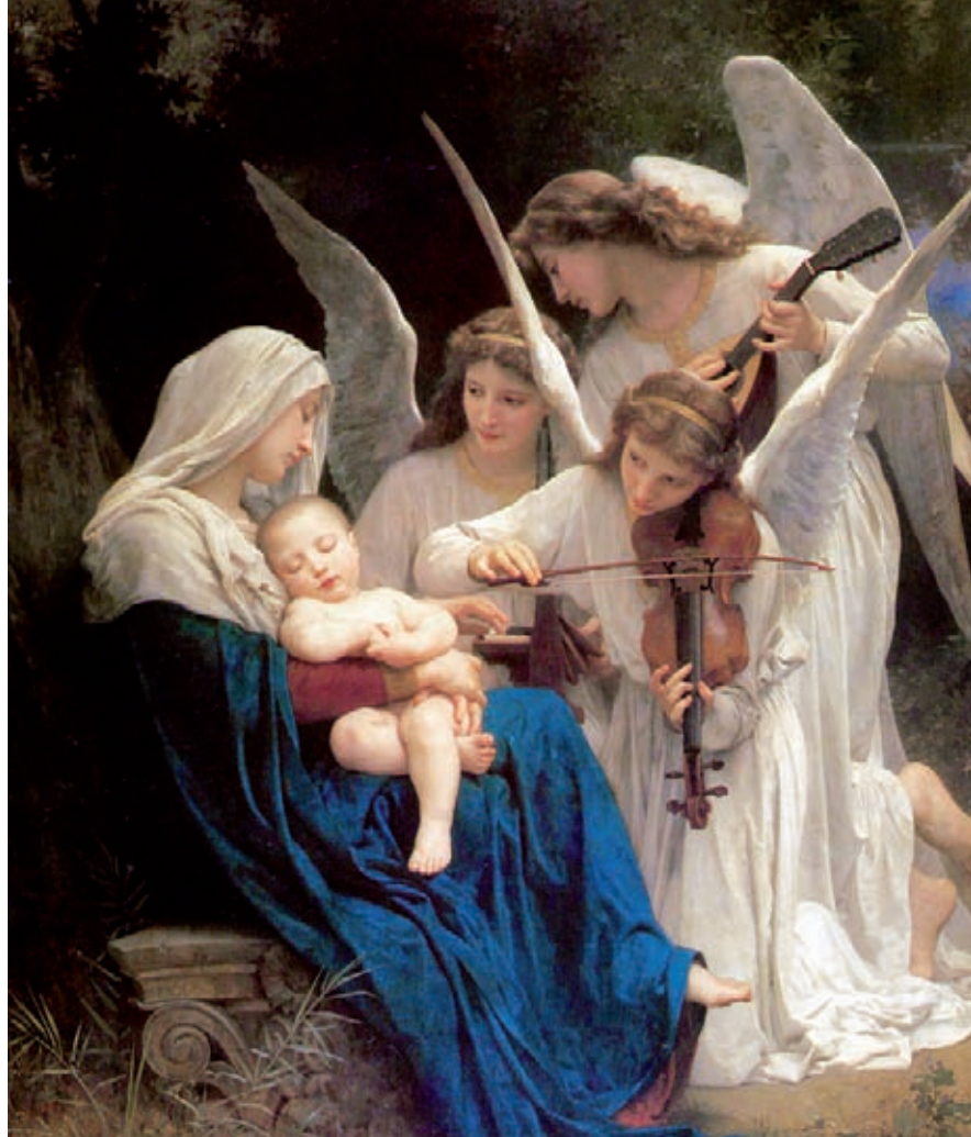
Bouguereau - Song of the Angels

Různé nástroje mají svůj specifický charakter, svou barvu, a proto se hodí k různým hudebním tématům. Ovšemže nejen volba nástrojů, ale i další hudební prostředky mají své duševní účinky. Pro klasicismus typický rytmus je například merkurický, zatímco rubato je venušinský prostředek, protože narušením pravidelného tempa podněcuje citění. Crescendo je martické. Gustav Holst řadu takových prostředků využil ve své symfonické suítě Planety .