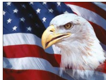
Americký orel a vlajka.

Moc je nejtěžší charakterová zkouška a mění toho, kdo ji získal. Současně s tím, jak se Řím stal impériem, změnil se z republiky na císařství. Obrovské provincie nebyly demokratické a ten, kdo jim vládl, zkorumpoval svou mocí a bohatstvím i samotný Řím. Senátoři se stali loutkami v rukou vojevůdců jako Marius či Caesar a velkých boháčů jako Pompeius či Crassus. Císaři však udržovali zdání republikánských institucí ještě dlouho poté, co už rozhodovali zcela sami.