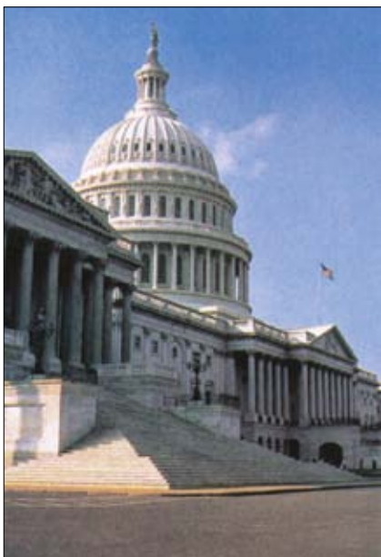
Kapitol Spojených států.

Spojené státy se podle všeho nacházejí právě v této fázi přechodu k faktické monarchii pod rouškou zdánlivé demokracie. V kabinetě amerického prezidenta se rozhoduje o celém světě, i o nás, ale nám do toho nic není. První muž Ameriky vystupuje jako císař světa, ale volit ho smějí jen Američané. Takto i římský císař diktoval podmínky provinčním zemím, ale volební právo zůstalo vyhrazeno jen Římanům v Itálii. Obyvatelé provincií si na římské občanství počkali 300 let.