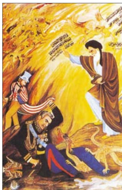
Ajatolláh Chomejní vítězí nad loutkovým šáhem, který se drží šosů amerického imperialismu. Plakát íránské revoluce, 1979.