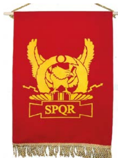
Orel na standartě římských legií.