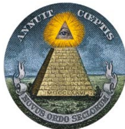
Velká pečeť USA (od roku 1782).

Orifielské přeměny se dotknou celého světa (i Evropské unii hrozí přeměna na centralizovaný monolit). Ale v Augustově éře to byly především dvě vysloveně saturnské říše, které si podmaňovaly svět ze západu a z východu: Řím a Čína. Bude to tak i nyní? Po roce 2050 Čína doběhne Spojené státy a stane se hospodářskou velmocí číslo jedna. Tento stát, kde císařská tradice ignorující svobodu jednotlivce nikdy nevymizela, prochází nebývalým rozmachem a skupuje nerostné bohatství Země.