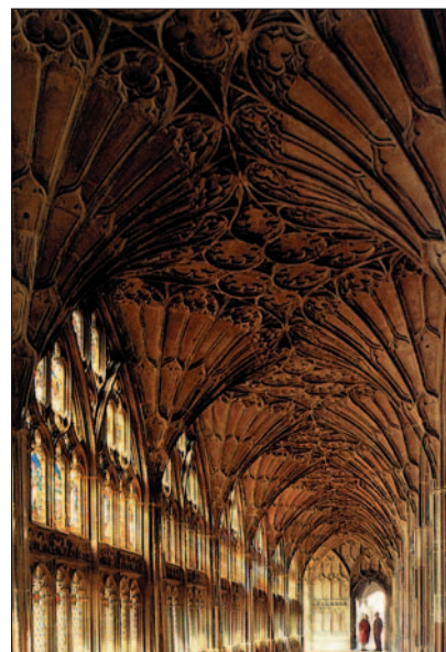
Die Flammengotik. Kathedrale in Gloucester, 14. Jh.

Gegen Ende des 13. Jahrhunderts entwickelte sich ein neuer Stil, die sogenannte Rayonnant- oder Strahlengotik (frz. rayon - Strahl). Die Bezeichnung des Stils leitet sich von der charakteristischen strahlenförmigen Anordnung des Maßwerks ab. Helligkeit, Glanz – der Sonnengeist hatte die Kathedralen berührt. Die Rayonnant- oder Strahlengotik war vom Sonnengeist im Michaelzeitalter 1269–1341 inspiriert! „Das neue Zierelement