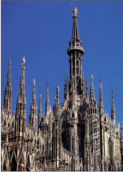
Die Flammengotik. Mailänder Dom, 14.-15. Jh.

waren ab Ende des 13. Jahrhunderts die typischen strahlenförmigen Motive des Maßwerks (Rayonnantgotik), und ab dem späten 14. Jahrhundert flämmchenförmige Motive (Flamboyantgotik), die zum ersten mal in England eingesetzt wurden“. 503