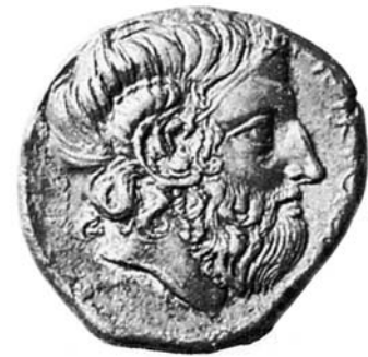
Profil Dia-Amona s typickými baranými rohmi egyptského boha na gréckej minci.

Nebudeme, samozrejme, tvrdiť, že by sa - hlavne v posledných dvoch-troch tisícročiach - s teologickými konštrukciami nebolo dosť často aj špekulovalo. Ale domnievať sa, že panteóny starovekých národov sú od začiat-