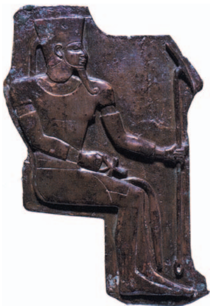
Amon, asi 700 pr. Kr.

ku, predovšetkým alebo iba výsledkom ľudských špekulácií, je tragický omyl. Zamarovský však - nevedno odkiaľ - má pocit istoty, že úlohou kňazov nebolo nič viac, ako krkolomnou teologickou ekvilibristikou dodatočne odvodňovať presuny politickej moci v krajine. Ak chceli Amona prehlásiť za najvyššieho boha, „ museli sa pritom vyrovnáť aj s takými problémami, aké predstavovala konfrontácia Amona so starými najvyššími bohmi Reom a Ptahom “ a preto vraj slnečného boha „ Rea mechanicky pripojili k Amonovi a vytvorili tak boha Amona-Rea, ktorý potom splynul v jedinú božskú osobnosť Amenrea “. 87