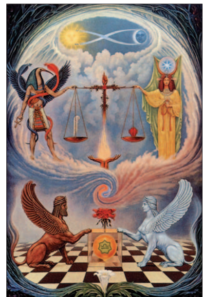
Johfra: Znamenie Váh.