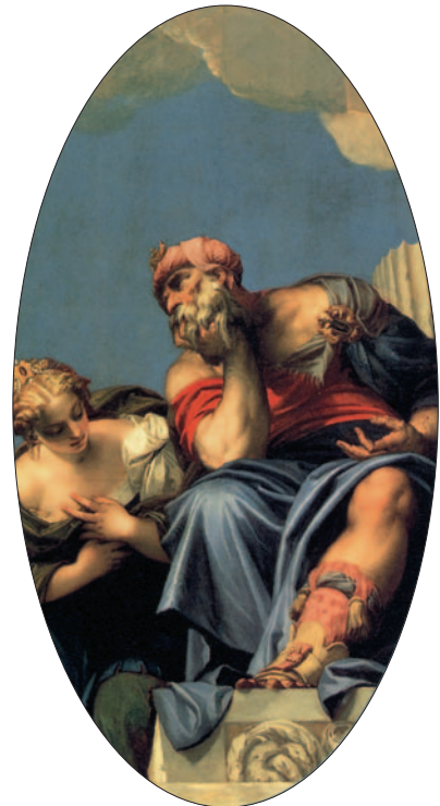
Paolo Veronese: Saturn ako latinský kráľ zo Zlatého veku, 1555.

Zaujímavé je nakoniec aj to, že v Etrurii a v Ríme sa ťažili kovy, „zvlášť