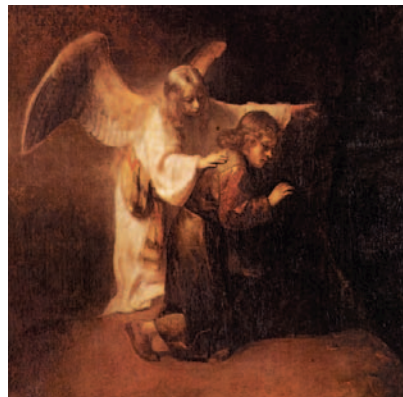
Rembrandt van Rijn: Prorok Daniel.

Medzi západnými učencami od čias Locka prevládla myšlienka, že „nič nie je v rozume, čo predtým nebolo v zmysloch“. Každá myšlienka, ktorú človek má, sa k nemu musela dostať zvonka, prostredníctvom fyzických zmyslov, alebo bola na základe týchto vnemov utvorená. Žiadne iné myšlienky nejstávajú. Toto tvrdenie však nebolo nikdy riadne zdôvodnené ani dokázané vedou v zmysle jej vlastných kritérií pravdivosti. Patrí k nezdôvodneným predpokladom materialistického svetonázoru, materialistickej viery. Ba bola od začiatku v rozpore s celým radom empirických faktov, ktoré nikdy