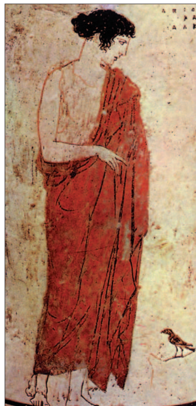
Stojaca múza. Attika, 5. stor. pr. Kr.

Začiatkom 20. storočia šokoval nevzdelaný mladík menom Šrínivás Rámanudžan, ktorý vyrástol v malej dedine v Indii, špičkových mate-