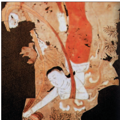
Letiaci génius. Stredná Ázia.

matikov v Cambridge svojím prekvapujúcim riešením vysoko komplikovaných matematických problémov. Podľa Rámanudžana mu túto matematickú múdrosť odovzdala v sérii objavných snov bohyňa dediny, z ktorej pochádzal, ktorej hovoria Námagiri.