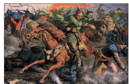
Hunskí jazdci, 19. stor.