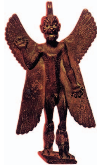
Pazuzu, démon horúčky. 1. tis. pr. Kr.

V najstarších časoch, keď ešte ľudia bezprostredne vnímali tieto démonické bytosti, ako prinášajú choroby, mala medicína podobu démonológie. V starobabylonskej a predbabylonskej démonológii boli jednotlivým chorobám priradené špecifické démonické bytosti. Jeden z najstrašnejších démonov bol Namtar, zloduch moru. Zachoval sa nám o ňom príbeh, ktorý je súčasťou mýtu o Ereškigale: „ Keď raz Namtar vstúpil do zhromaždenia bohov, povstali títo pred ním úctivo - pozoruhodný prejav pocty obyčajnému démonovi... Jedine boh vojny Nergal nepovstal pred poslom bohyně smrti “. 131 Pravdaže. Veď Nergal-Mars je Namtarovým pánom!